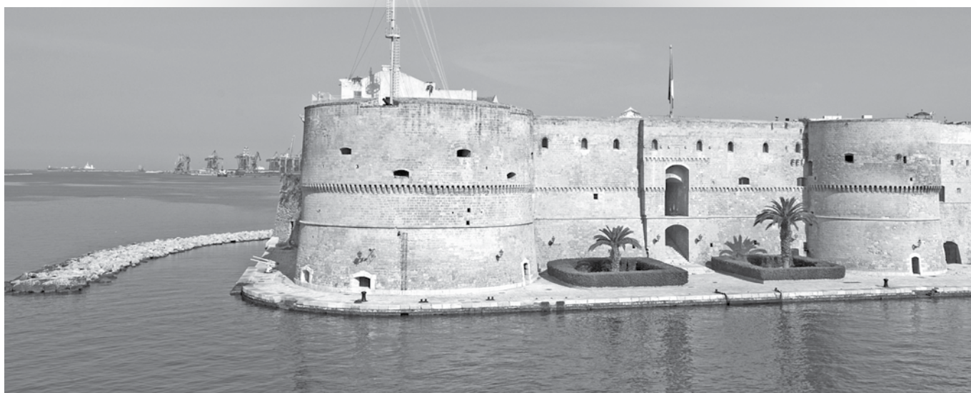
Castello Aragonese - Taranto