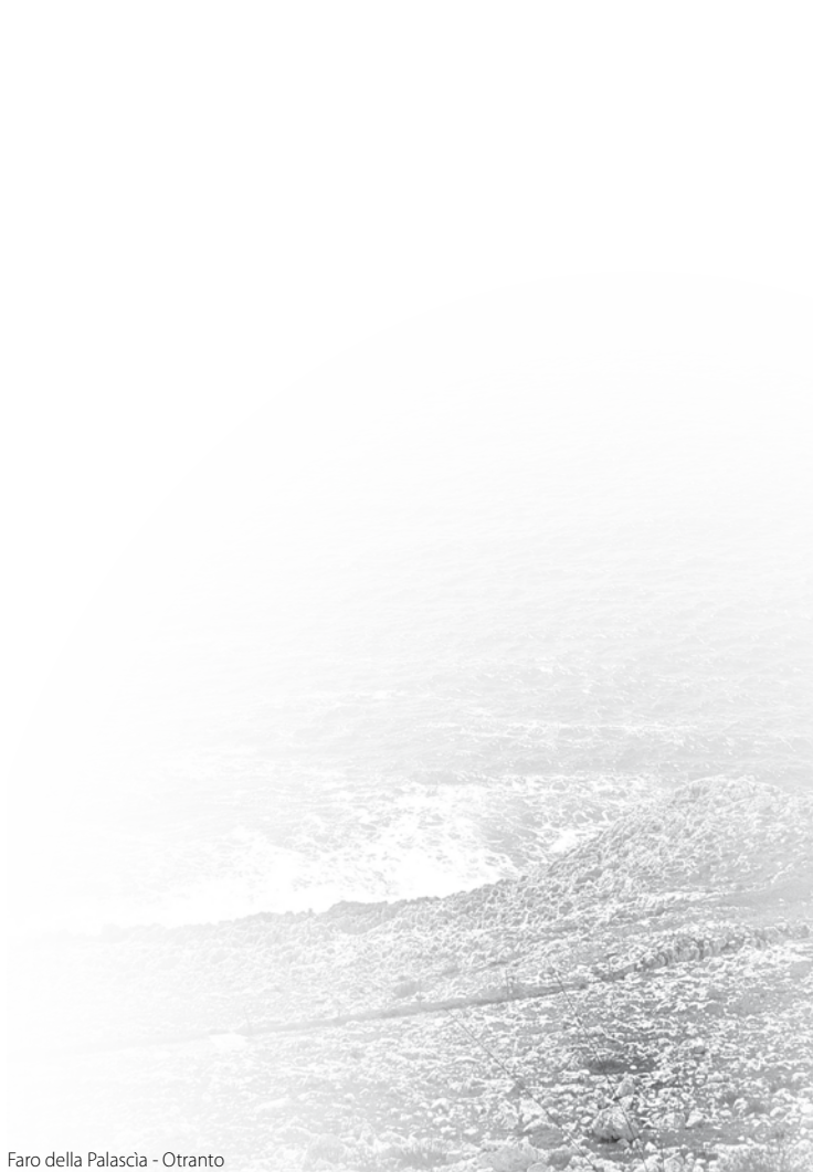
Faro della Palascia - Otranto