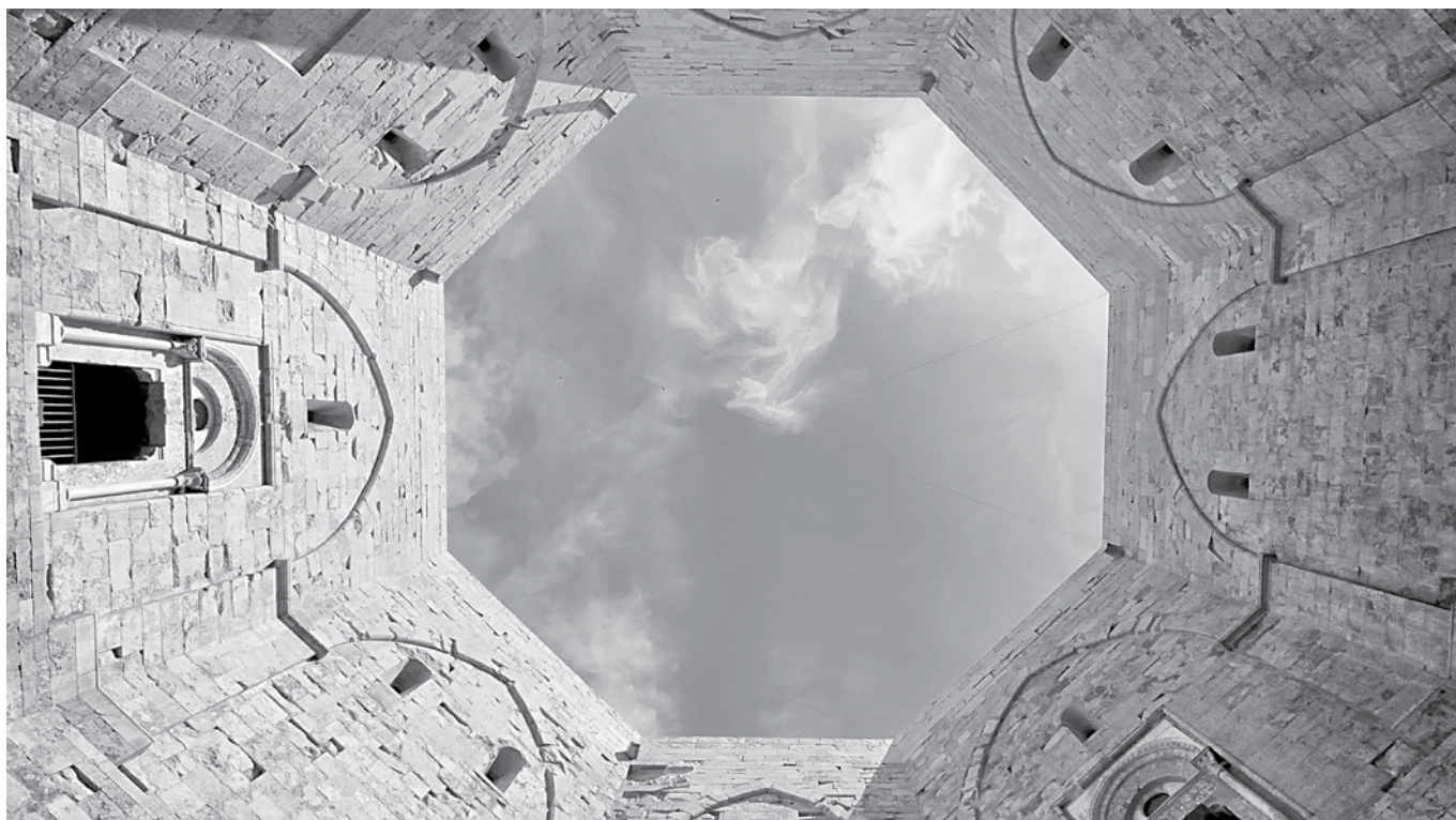
Castel del Monte - Andria