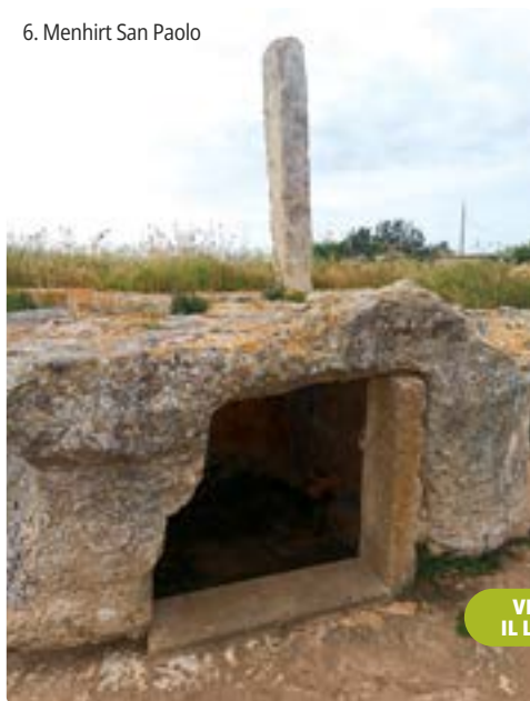
6. Menhir San Paolo