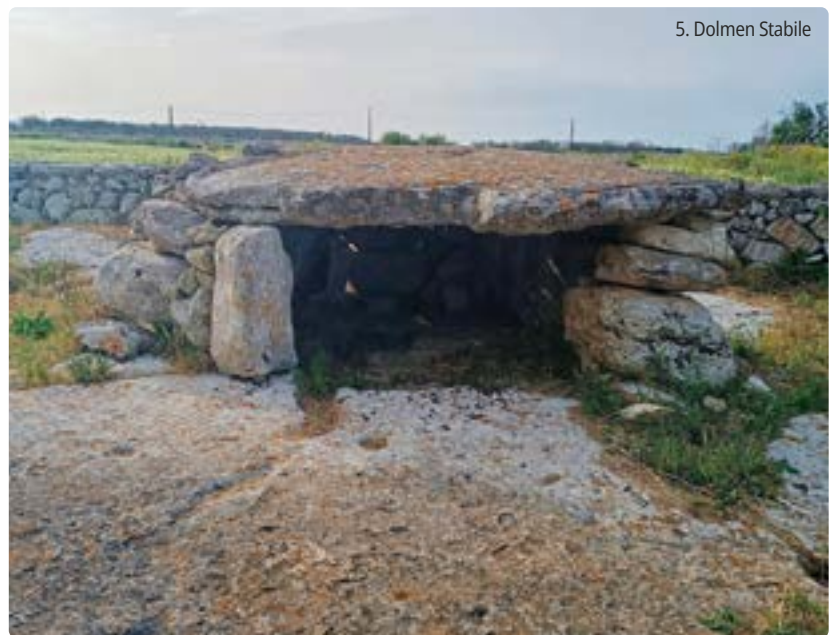
5. Dolmen Stabile