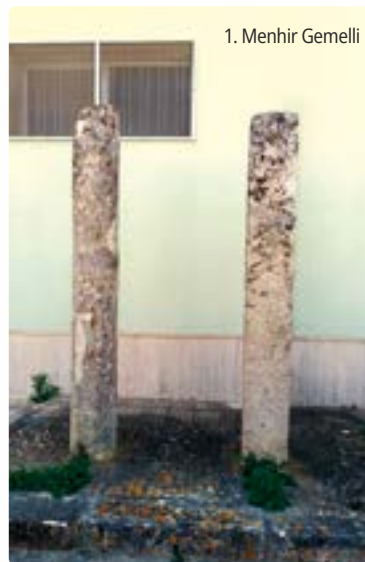
1. Menhir Gemelli

Facciamo un deciso balzo in avanti nella macchina nel tempo, ne vale la pena: i Gemelli sorgono non lontano dal Trappitello del Duca , frantoio ipogeo del XVI secolo perfettamente ristrutturato, in cui troviamo tutti gli strumenti utili alla produzione dell'olio di oliva e una suggestiva illuminazione della macina in tenera pietra locale.