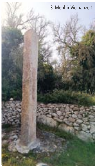
3. Menhir Vicinanze 1